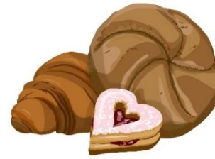
Brioche con marmellata