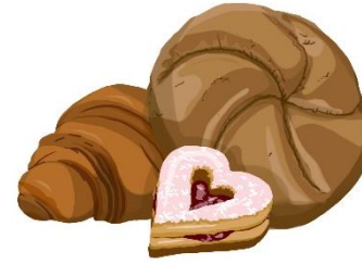
Brioche con marmellata